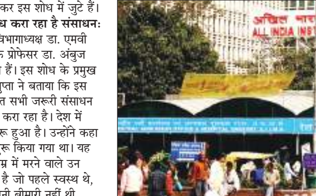
कोरोना के दौरान मरने वाले 250 लोगों की आटोप्सी रिपोर्ट को इसमें शामिल किया जाएगा। वहीं, कोरोना के बाद के करीब 200 मृतकों आटोप्सी कर शोध किया जाएगा। उन्होंने बताया