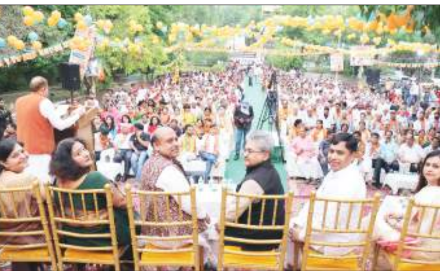
रोहिणी विधानसभा क्षेत्र में डीसी चौक सेक्टर 9 रोहिणी में मुख्यमंत्री केजरीवाल के काले कारनामों का भंडाफोड़ करने के लिए बीजेपी विधायक विजेंद्र गुप्ता ने जनसभा को संबोधित किया।